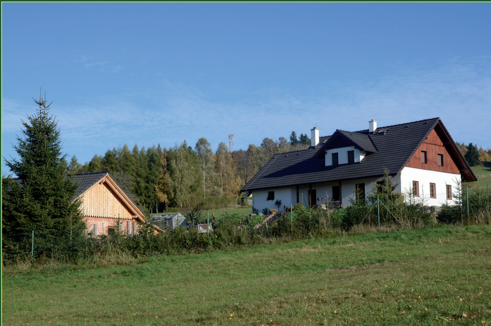
Sendraž - pohled při příjezdu od Mezilesí na kopec směrem k nové rozhledně.