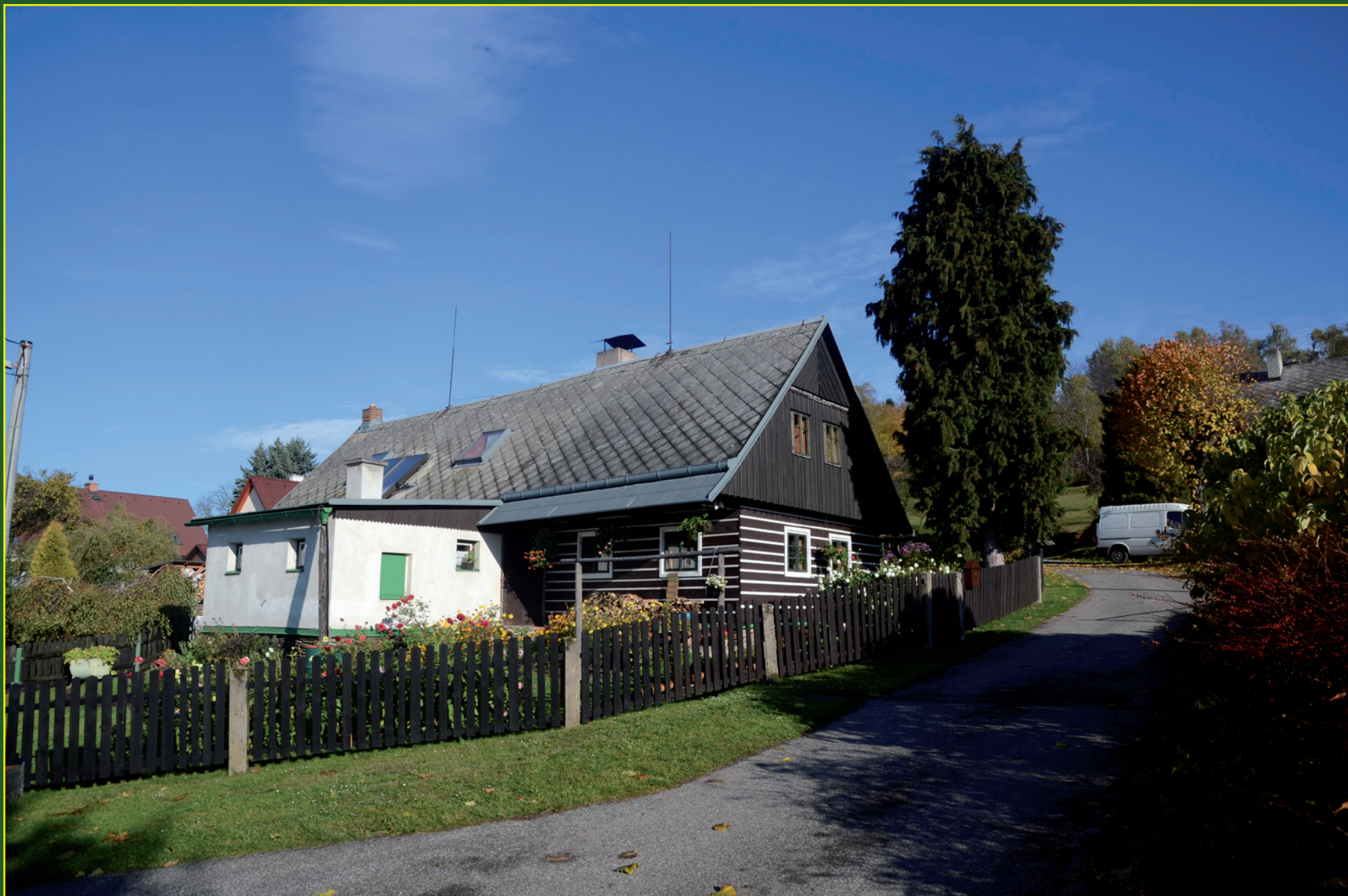
Sendraž - pseudoroubená chalupa u cesty k Sv. Floriánu (hospoda).