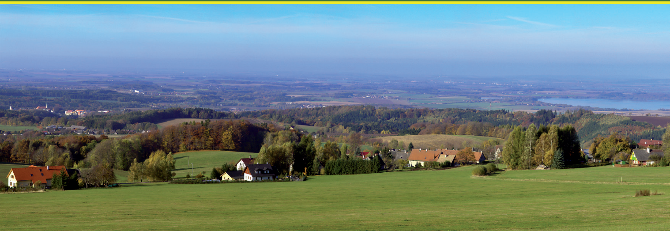
Pohled ze stráně nad vesnicí Sendraž přes vesnici do kraje směrem ke Hradci Králové. Vlevo Nové Město nad Metují, vpravo vodní nádrž Rozkoš